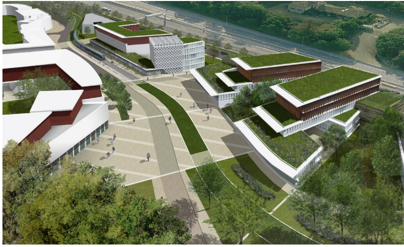
Le parc actif de Carriet (Artotec)