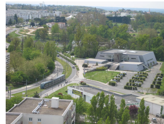
Maison des Sports des Iris