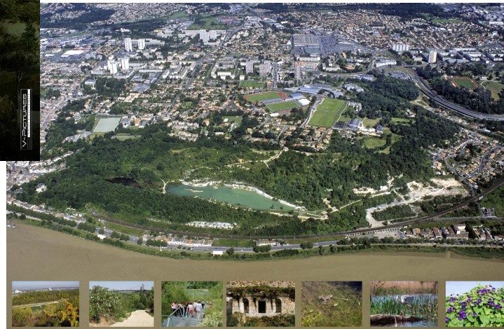
Le parc de l'Ermitage