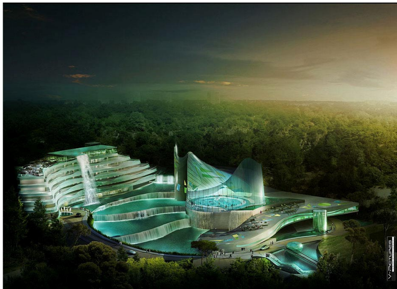
Les cascades de Garonne (JM Ruols)