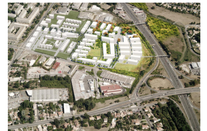
La Ramade (plan guide Agora)