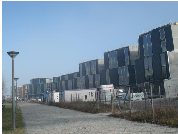
Résidence « les vues » (en arrière-plan : « les Yoies »)